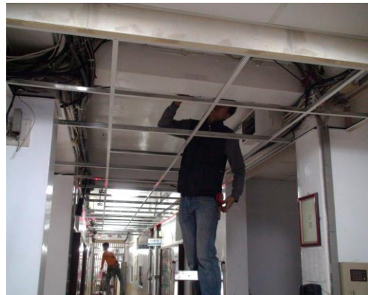
圖二：嚴謹規劃天花板與管線走向。