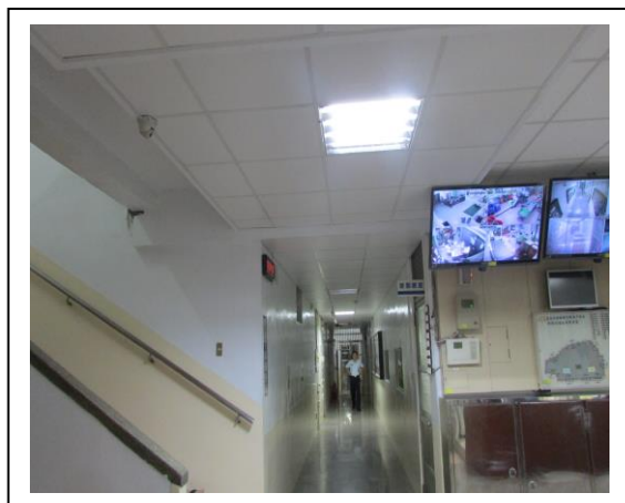
圖三：營造簡潔明亮戒護氛圍。