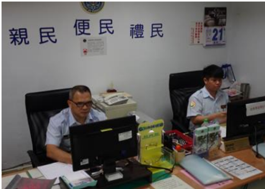
接見受理與單一服務窗口