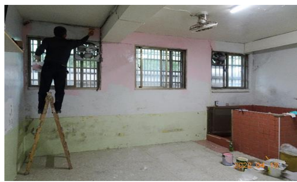
(一) 忠舍療養房整新計畫施工完畢(牆面粉刷、裝設不鏽鋼水槽、鋪設地板)