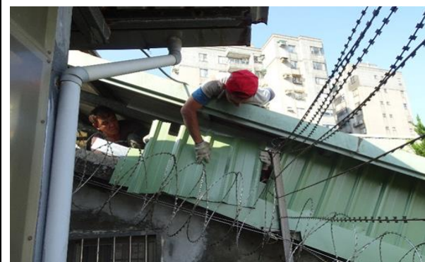
(六)廠商修剪行政大樓前面馬路樹木通道，及宿舍區停車場樹木，並清除黑腰虎頭蜂窩(直徑 90 公分)，預防颱風侵襲造成人員受傷或車輛物品損壞，使本監樹木避免遭遇颱風吹斷，造成人員受傷、車輛損毀，減少落葉堵塞屋頂排水槽，難以清理。