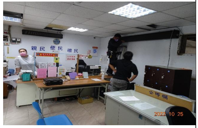
(八) 消防設施維修，健全火災警報系統，保障人員建物免於火災危險