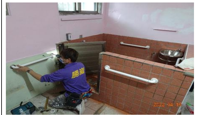
(二) 因本監位處山坡地，建築空間高低落差大且樓梯眾多，對於罹有傷病或老年之收容人行走上較為吃力不便，本年度於療養舍至中央台走廊區域及通往炊場階梯處，增設無障礙扶手，及